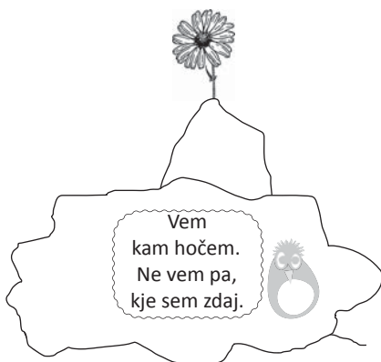
Ni analize stanja, nedosegljiva vizija