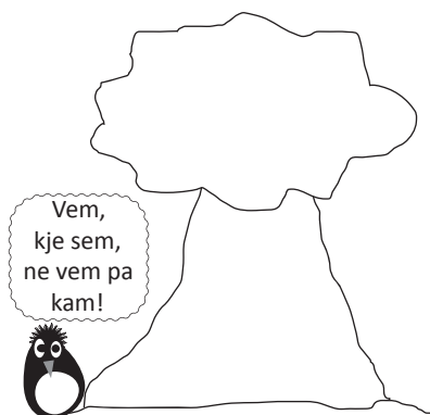
Dobra analiza stanja, brez vizije