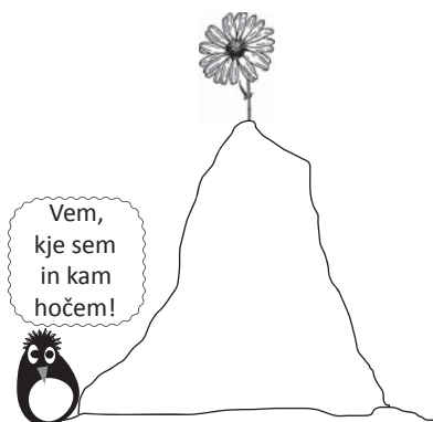
Dobra analiza stanja, jasna vizija

Planinec, ki zaradi megle ob vznožju gore ne ve, kje se trenutno nahaja, obenem pa mu zaradi oblakov, ki zakrivajo vrh, tudi ni povsem jasno, kam želi priti, bo zelo težko našel ustrezno pot. Celó če jo bo našel, bo med tavanjem izgubil veliko energije in časa. Veliko bolj verjetno kot to, da bo dosegel vrh je, da bo brezciljno taval po brezpotjih, pri čemer se kaj lahko zgodi, da se bo na koncu znašel na kraju, ki bo za vzpon na vrh še dosti bolj neprimeren kot je bila njegova izhodiščna točka.